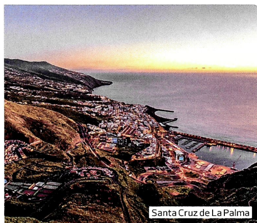
Santa Cruz de La Palma