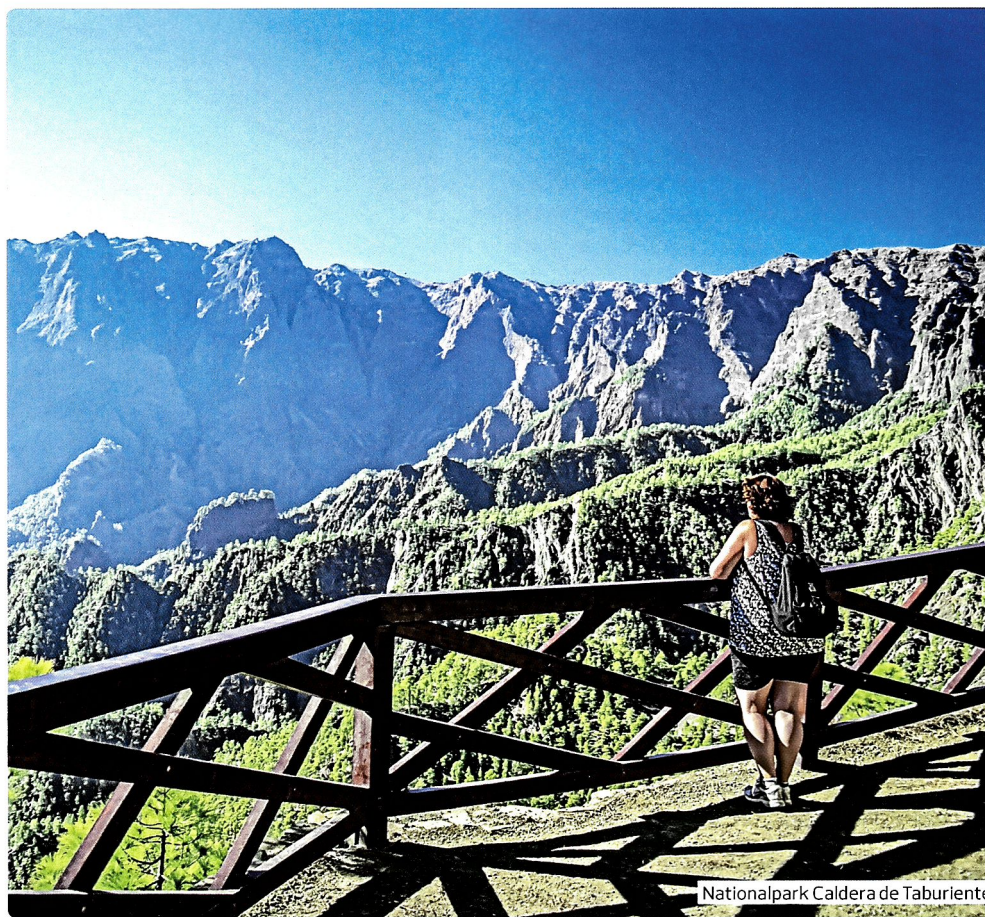
Nationalpark Caldera de Taburiente