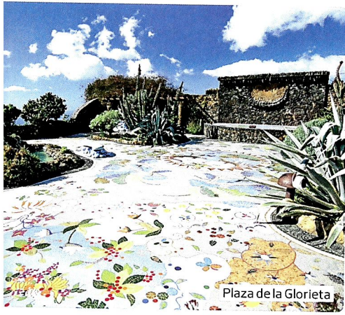
Plaza de la Glorieta